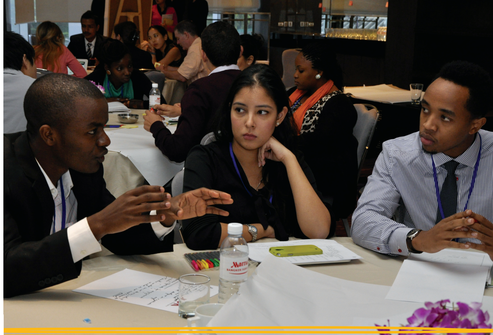
Jóvenes participantes del Foro de la UNESCO sobre la ECM en Bangkok, Tailandia, en diciembre de 2013.