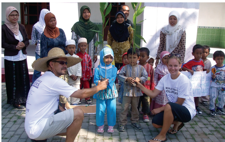
Campaña de Voluntarios del Patrimonio Mundial 2010, Prambanan, en las instalaciones del sitio del Patrimonio Mundial de la humanidad en el Templo Prambanan, Indonesia.