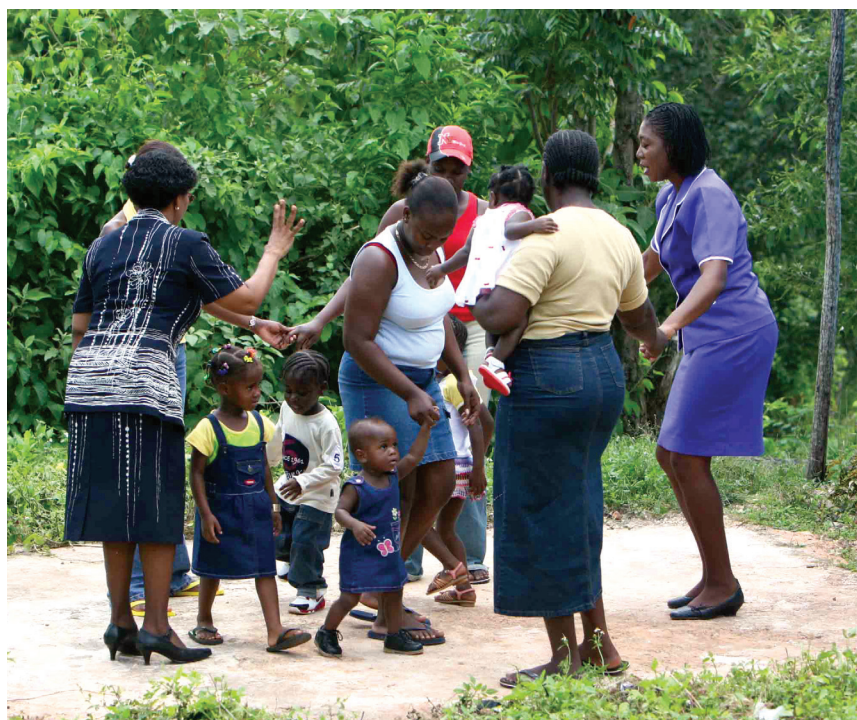
Un programa de base comunitaria de ECCE, en Clarendon, Jamaica.