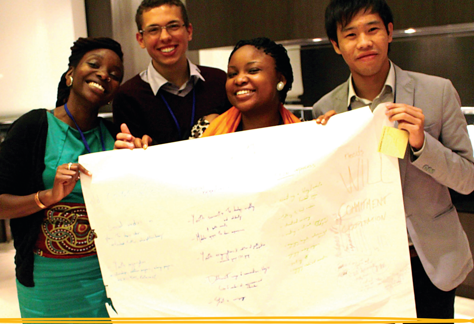
Jóvenes participantes del Foro de la UNESCO sobre la ECM en Bangkok, Tailandia, en diciembre de 2013.